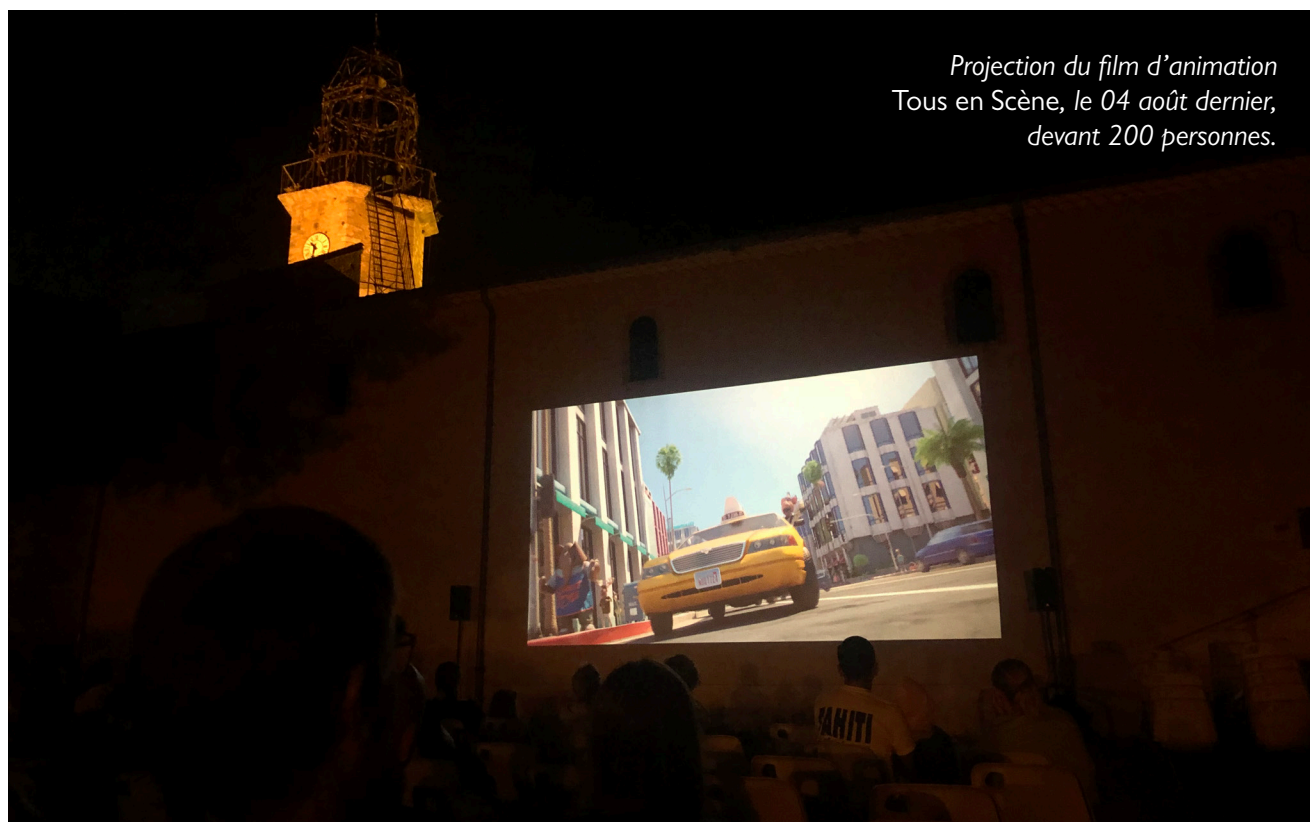
Projection du film d'animation Tous en Scène, le 04 août dernier, devant 200 personnes.

UN ÉTÉ 2024 MARQUÉ PAR LES FESTIVITÉS ET LA CONVIVIALITÉ